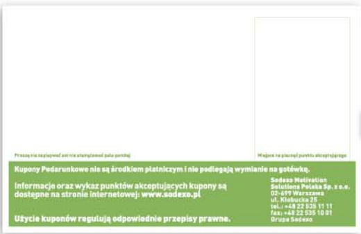
Dotychczasowy Kupon (rewers)