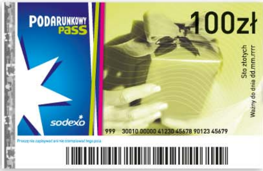
Dotychczasowy Kupon (awers)